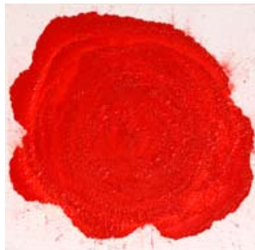
Red Rose 30x30 Tecnica Mista su tela