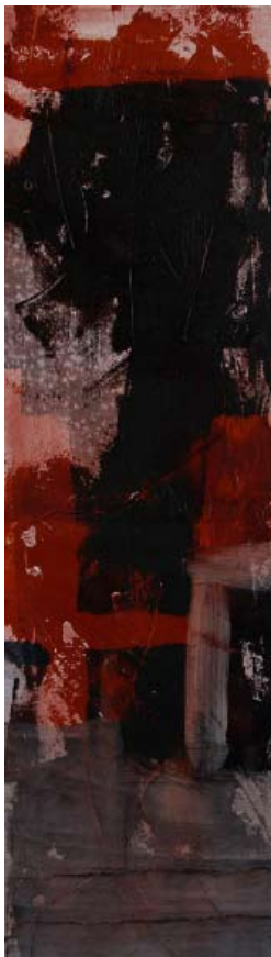
L'inizio 30x100 tecnica mista su tela