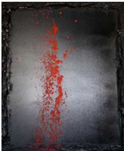
La Sangre 120x100 Tecnica Mista su tela