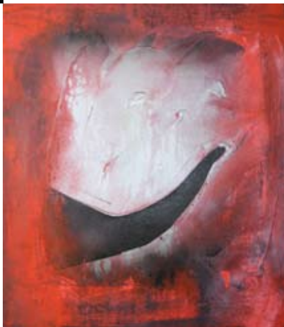
Inferno 80x90 Tecnica Mista su tela