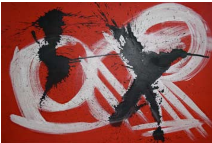
Prospettiva 150x100 Acrilico su tela