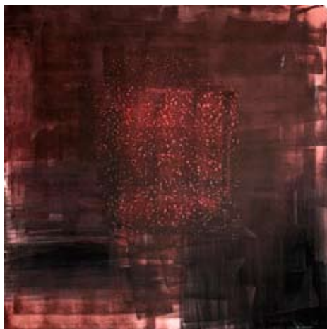
In Vino Veritas 100x100 Acrilico su tela