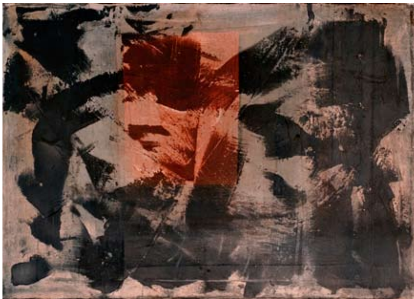
Fotografia 50x70 Tecnica Mista su tela