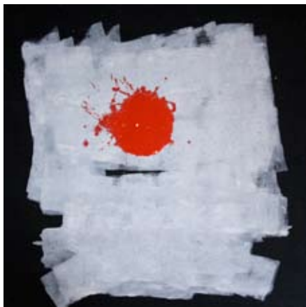
Zen 90x90 Acrilico su tela